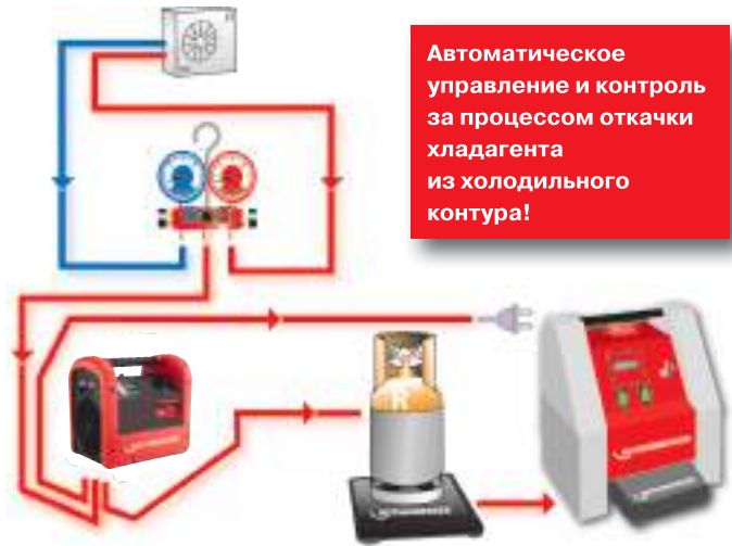
Применение ROKLIMA MULTI 4F (слив и заполнение)

Автоматическое управление и контроль за процессом откачки хладагента из холодильного контура!