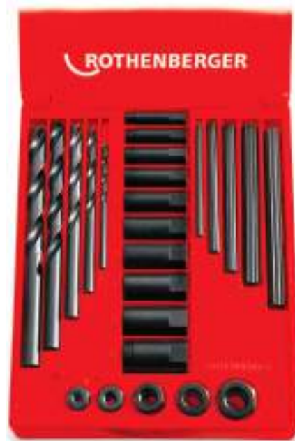
Набор для выворачивания сломанных болтов из 25 предметов, № 71311