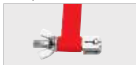
Четырёхгранный зажим с поперечными пазами